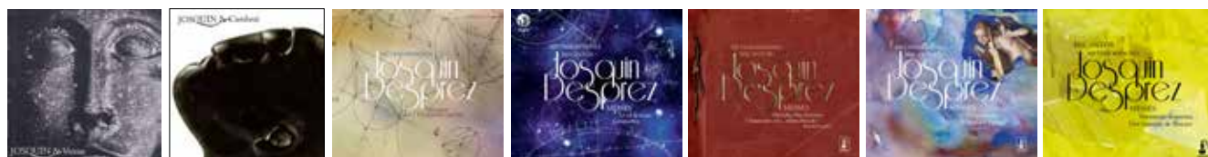
Vol.1 Josquin et Venise